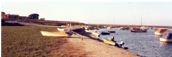
Sønderho Naturhavn ca. 1980.

Færdsel ved Sønderho Havn er på eget ansvar. Der kan være blød bund langs kanten af renden. Børn bør være under opsyn af voksne.