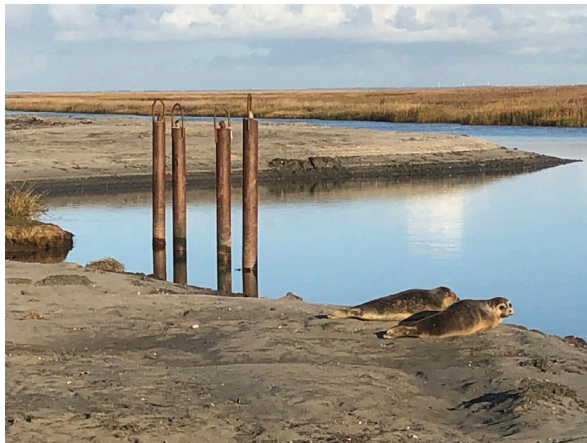
To sæler slog sig ned ved den uddybede sejlrende i november 2020.

Sønderho Havn Støtteforening har i samarbejde med Fanø Kommune uddybet tidevandsrenden Slagters Lo, der siden 1990'erne har været tilsandet. Fra 2021 kan man igen sejle med mindre både til og fra Sønderho.