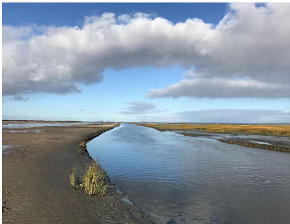
Den uddybede sejlrende til Sønderho (2020)

Sønderho Havn Støtteforening har i samarbejde med Fanø Kommune uddybet tidevandsrenden Slagters Lo, der siden 1990'erne har været tilsandet. Fra 2021 kan man igen sejle med mindre både til og fra Sønderho.