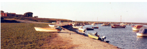
Sønderho Naturhavn ca. 1980.

Færdsel ved Sønderho Havn er på eget ansvar. Der kan være blød bund langs kanten af renden. Børn bør være under opsyn af voksne.